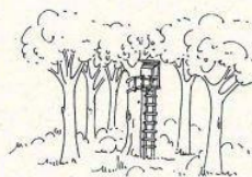
Tipologia su albero