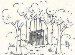
Tipologia parzialmente aperta