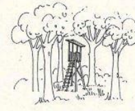
Tipologia autoportante, di altezza non superiore agli alberi limitrofi